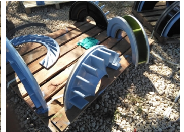
Componentes con capa Final.