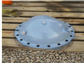
Tapa con capa final de Belzona 1341N (Supermetalgilde).