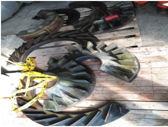
Componentes antes de grit blasting

Los componentes internos del compresor requerían un sistema de recubrimiento de protección contra la corrosión.