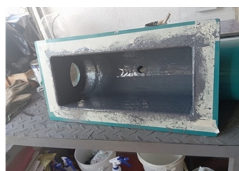
Aplicación de Belzona 1321 (Ceramic S-Metal) en curso.