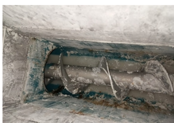
Corrosión en las soldaduras que afectaba la calidad del producto.