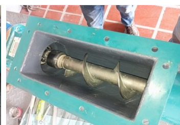
Canal finalmente protegida con Belzona 1321 (Ceramic S-Metal)